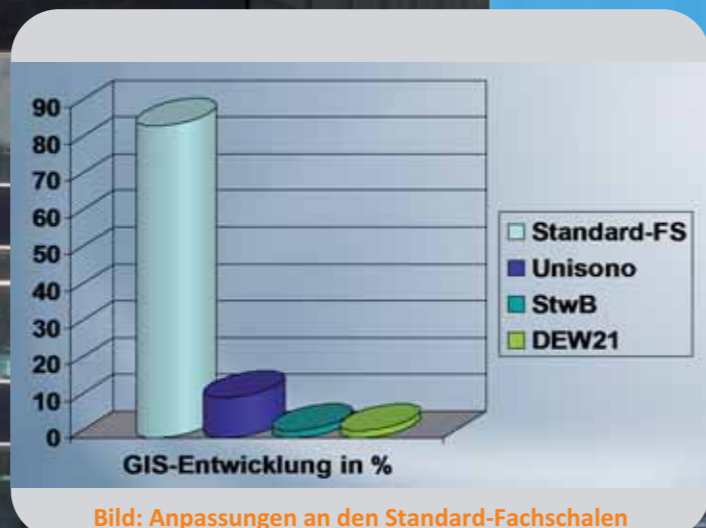
Bild: Anpassungen an den Standard-Fachschalen