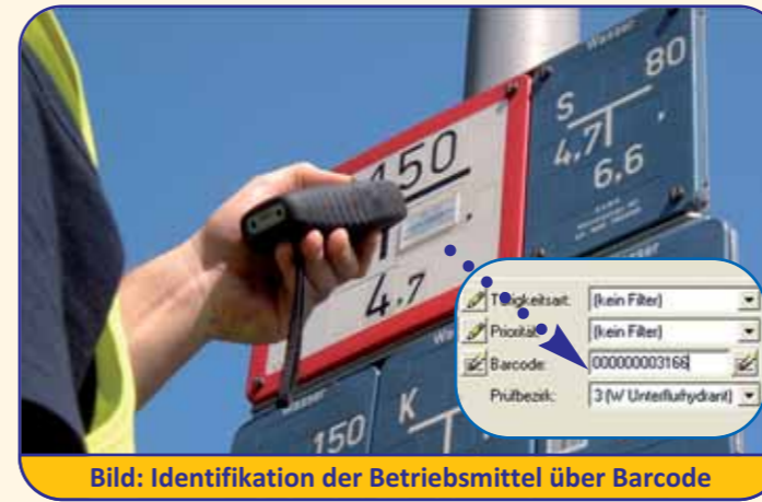
Bild: Identifikation der Betriebsmittel über Barcode