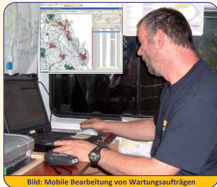
Bild: Mobile Bearbeitung von Wartungsaufträgen