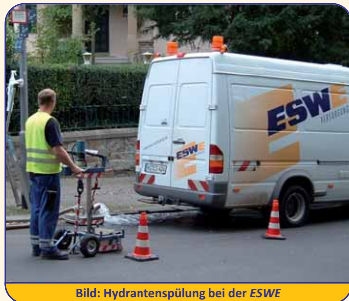
Bild: Hydrantenspülung bei der ESWE

Der Ablauf der mobilen Instandhaltung ist bei der ESWE in 13 Teilschritte unterteilt: 1.) Zunächst müssen die Objekte, die instandgehalten werden sollen, im System dargestellt werden. Über die angelegten Objekte kann der Anwender dann nach bestimmten Kriterien (z.B. Objektklasse , Barcode , Prüfbezirk ) filtern. Als Ergebnis erhält man eine Liste der zu prüfenden Objekte. Aus dieser Liste werden für die zugehörigen Objekte Aufträge angelegt. 2.) Der Auftrag wird einer Person oder einer Personengruppe zugewiesen. Dieser Vorgang wird im Rahmen der Auftragsöffnung durchgeführt. Zuweisungen lassen sich auch nachträglich bearbeiten. 3.) Die angelegten Daten werden mit Hilfe des Moduls Location Sync auf den Server geschickt. Darüber hinaus werden die jeweiligen Clients mit den Server-Daten aktualisiert. 4.) Nach der Aktualisierung der Notebooks stehen den Monteuren nun die Aufträge mobil zur Verfügung und die eigentliche Instandhaltungsarbeiten können vor Ort beginnen.