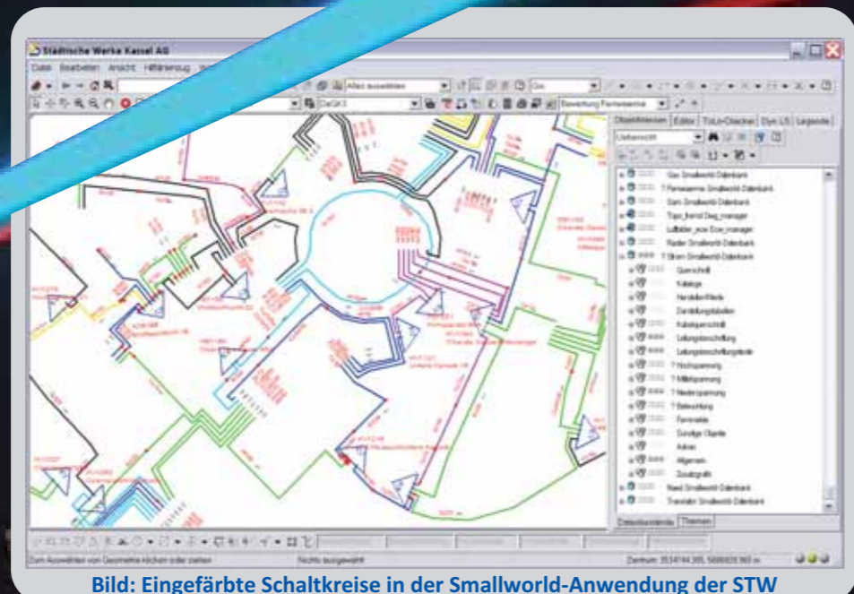
Bild: Eingefärbte Schaltkreise in der Smallworld-Anwendung der STW

Vermessung mit direkter Bildung von Datenbankobjekten.